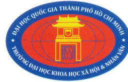
TRƯỜNG ĐẠI HỌC KHOA HỌC XÃ HỘI VÀ NHÂN VĂN